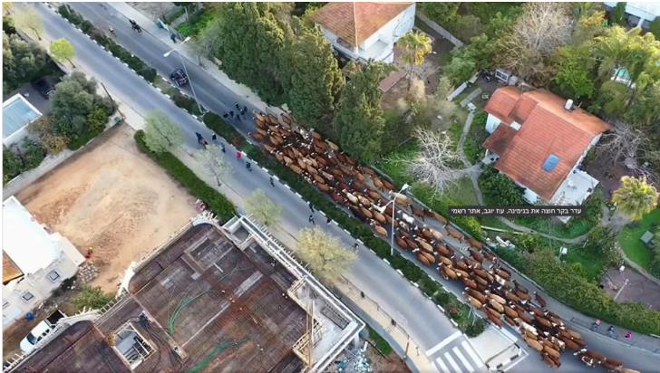
בנימינה: מושבה פסטורלית, המוקפת בכרמים, שדות ומטעים

מאבק בין רומנטיקה לפרקטיקה: המושבה הפסטורלית בנימינה, המוקפת בכרמים, שדות ומטעים נמצאת בימים אלו במאבק על עתידה. תכנית המתאר שהופקדה מאיימת להחריב את המושבה הציורית ולהפוך אותה לעיר נוספת במדינת ישראל, שזורה ברבי קומות, עם פי 6 תושבים.